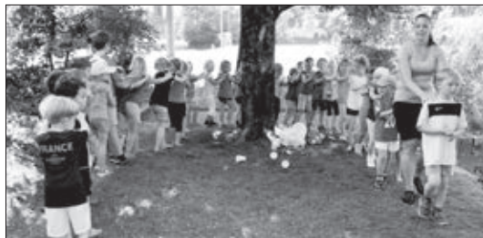
Die KiTu 1 Kinder mit Elan beim Turnen.