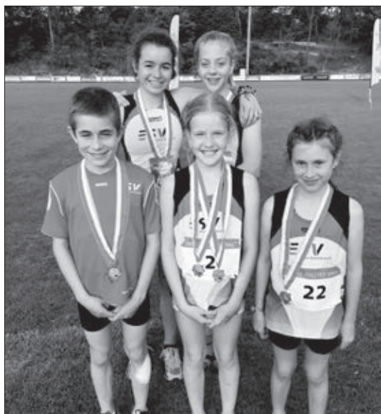
Die stolzen Medaillen-Gewinner 1000m Lauf.

Der Schnellste Seetaler gehört traditionsgemäss zu einem der Höhepunkte in der Leichtathletik-Saison. Nach den Vorläufen qualifizieren sich die sechs schnellsten Sprinter/-innen für den Finallauf (je nach Kategorie 50 m, 60 m oder 80 m). Im Anschluss finden jeweils die 1000 m Läufe statt.