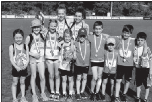
Die schnellen Sprinter mit Medaillen.