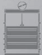
Wey Kanal- absperrorgane

Wey bietet höchste Sicherheit. Jeden Tag. Rund um die Uhr.