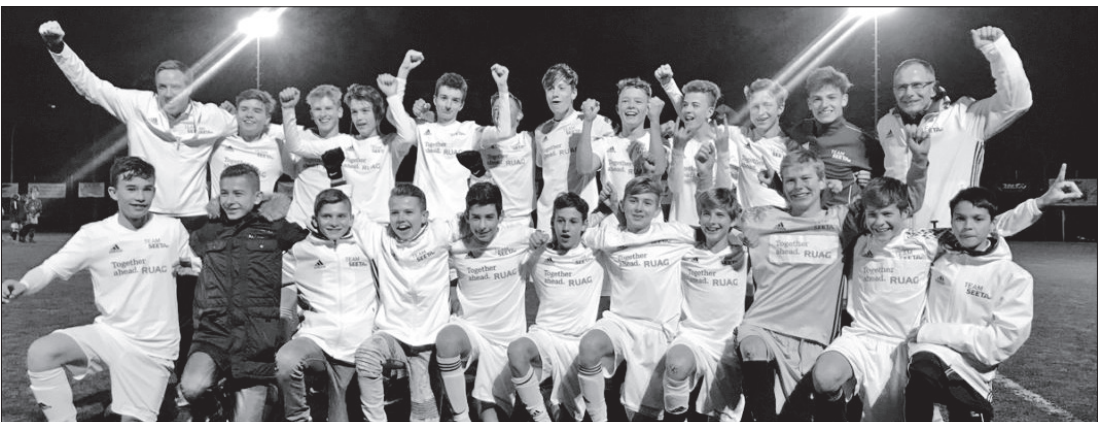
Das Team Seetal jubelt nach dem Spiel – Wintermeistertitel!