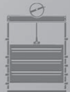
Wey Kanal- absperrorgane

Wey bietet höchste Sicherheit. Jeden Tag. Rund um die Uhr.