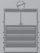
Wey Kanal- absperroorgane

Wey bietet höchste Sicherheit. Jeden Tag. Rund um die Uhr.