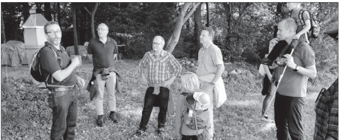
Beim Einhörnli, dem höchsten Punkt von Eschenbach.