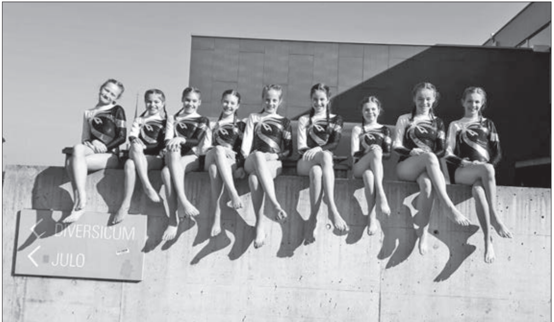
Die Turnerinnen der Kategorie 3.