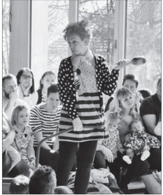
Pitch macht sich auf den Weg.

Bevor das Konzert losging genossen die Kinder das grosse Mattenfeld und tobten sich aus. Als die Mitglieder der Feldmusik auf ihren Stühlen Platz nahmen, setzten sich die kleinen Gäste möglichst nahe bei den Musikanten